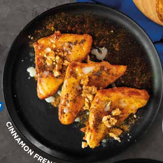
CINNAMON FRENCH TOAST