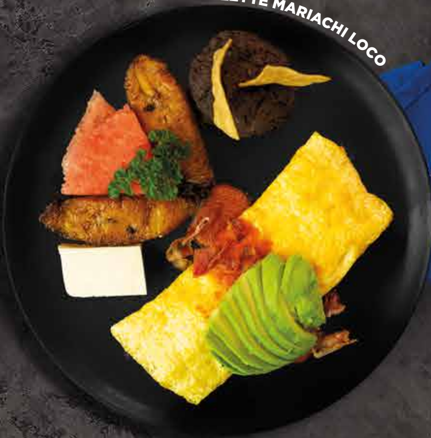
OMELETTE MARIACHI LOCO