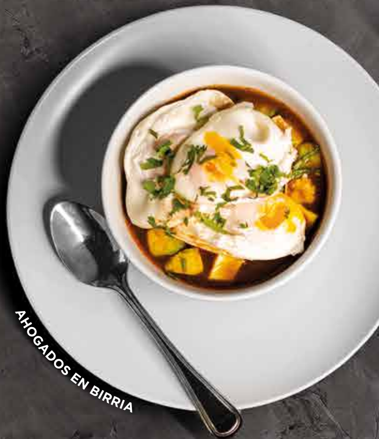
AHOGADOS EN BIRRIA

2 huevos estrellados sobre una quesadilla rellena de chorizo, queso oaxaca y cilantro, bañada con salsa verde