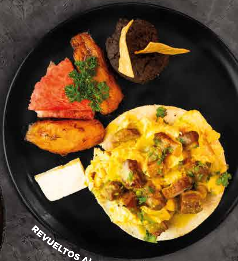
REVUELTOS AL ALBAÑIL